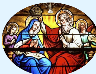
Le Couronnement de la Vierge.

Entrez dans l'église, vous serez accueillis sur un fond musical, un dépliant est disponible pour une visite plus approfondie et tous les ans, aux Journées du Patrimoine, des visites sont organisées.