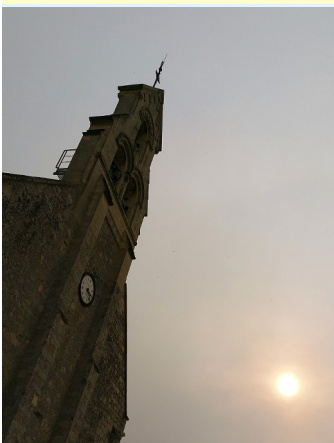
Mathieu: église Notre Dame de l'Assomption